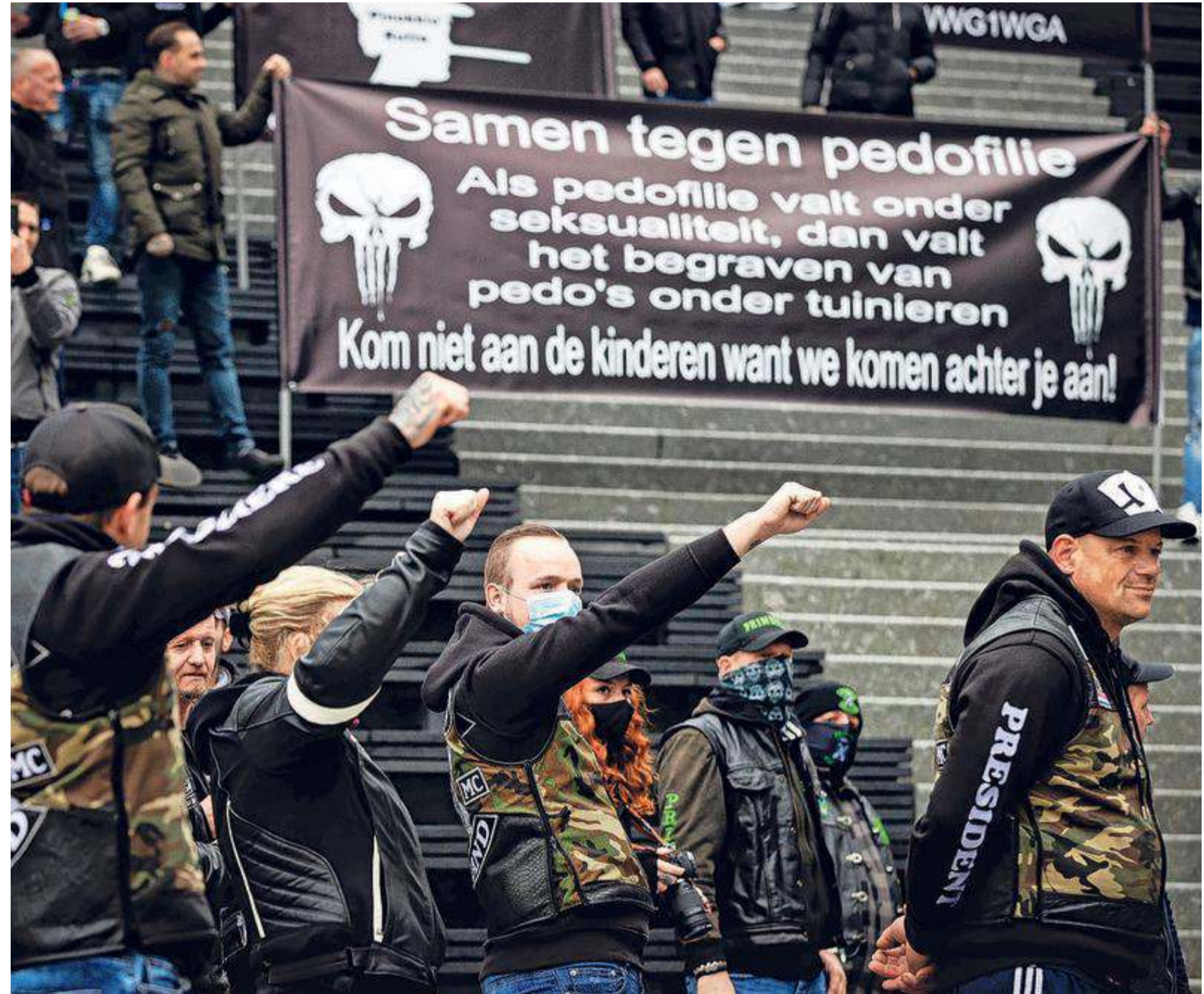
Het nieuw leven inblazen van de Partij voor Naasteliefde, Vrijheid en Diversiteit, ook wel pedopartij, leidde tot demonstraties en vooral tot pedojachten in alle delen van het land.

Veel meer mannen komen bij de Waag binnen na een veroordeling voor seksueel grensoverschrijdend gedrag